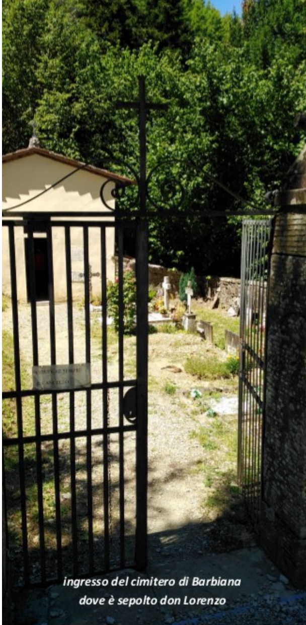
Ingresso del cimitero di Barbiana dove è sepolto don Lorenzo

Creatore può dire a ciascuno di noi: «Prima di formarti nel grembo materno, ti ho conosciuto» (Ger 1,5). Siamo stati concepiti nel cuore di Dio e quindi «ciascuno di noi è il frutto di un pensiero di Dio. Ciascuno di noi è voluto, ciascuno è amato, ciascuno è necessario».