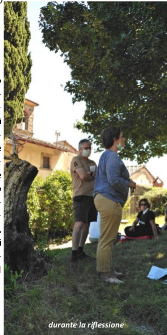
durante la riflessione