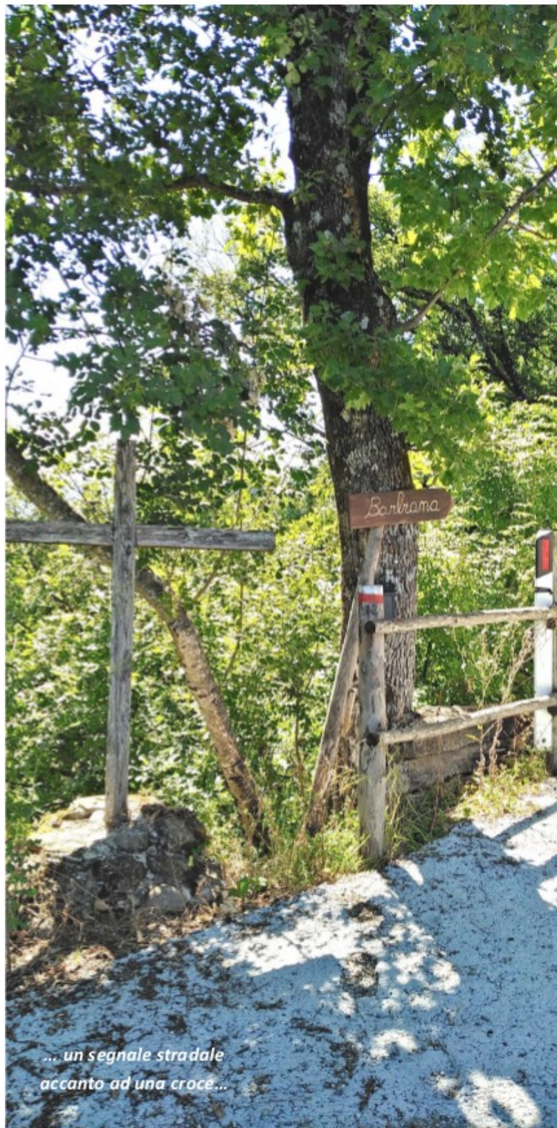
... un segnale stradale accanto ad una croce...

Sono riprodotte in questa puntata del Diario dell'Estate Adulti Ac Diocesi di Imola alcune pagine del catalogo illustrativo della mostra itinerante Gianni e Pierino, La scuola di Lettere ad una professoressa , edito da Fondazione Don Lorenzo Milani, maggio 2019. Per ogni foto, è indicata la pagina del catalogo.