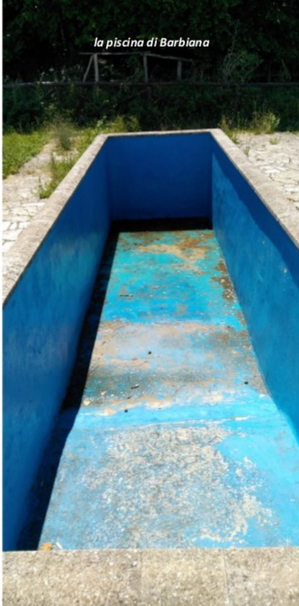
la piscina di Barbiana

gi e norme non è sufficiente a lungo termine per limitare i cattivi comportamenti, anche quando esista un valido controllo. Affinché la norma giuridica produca effetti rilevanti e duraturi è necessario che la maggior parte dei membri della società l'abbia accettata a partire da motivazioni adeguate, e reagisca secondo una trasformazione personale. Solamente partendo dal coltivare solide virtù è possibile la donazione di sé in un impegno ecologico. Se una persona, benché le proprie condizioni economiche le permettano di consumare e spendere di più, abitualmente si copre un po' invece di accendere il riscaldamento, ciò suppone che abbia acquisito convinzioni e modi di sentire favorevoli alla cura dell'ambiente. È molto nobile assumere il compito di avere cura del creato con piccole azioni quotidiane, ed è meraviglioso che l'educazione sia capace di motivarle fino a dar forma ad uno stile di vita. L'educazione alla responsabilità ambientale può incoraggiare vari compor-